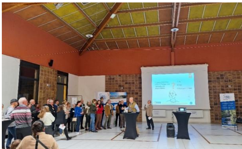
Les participants se sont positionnés dans une zone afin de répondre à une question posée lors de la présentation