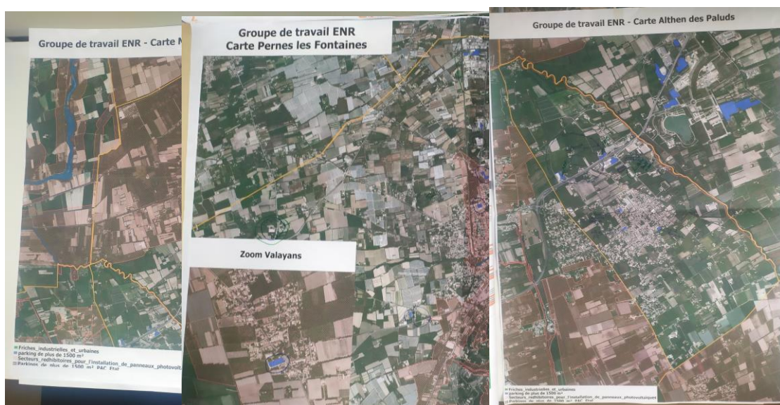
Extrait des cartes travaillées en atelier

Une calendrier de travail a été proposé aux communes afin de prévoir la réalisation des cartes par type d'énergie renouvelable, le débat sur la cohérence des zones, la concertation de la population puis la délibération avant envoi au Préfet.