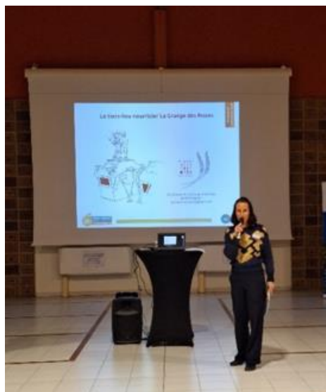
Présentation du partenaires « La Grange des roues »