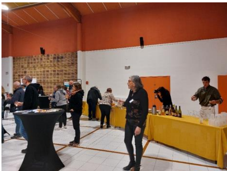
Apéritif réalisé par La Grange des roues, porteur d'une action du PCAET