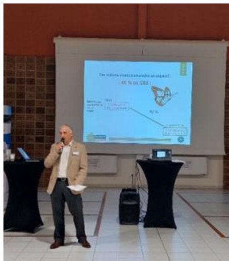
Présentation de M. Mossé, vice président à la transition écologique en charge du PCAET