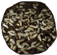
Larves de mouche soldat