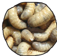
Larves de cétoine dorée